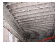
アスベスト含有吹付け ロックウール (鉄骨材の耐火被覆)