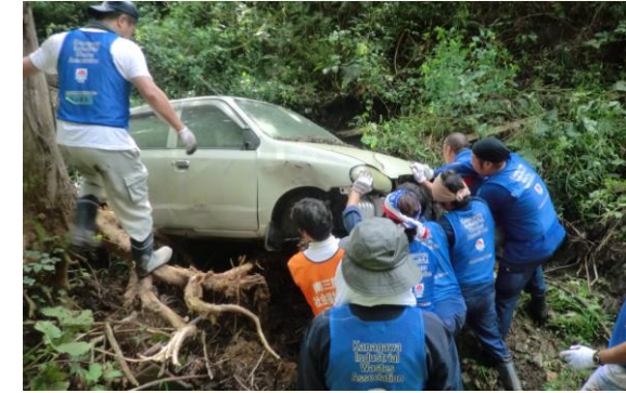
全国産業廃棄物連合会青年部協議会 10回全国大会 北海道・東北大会 in 仙