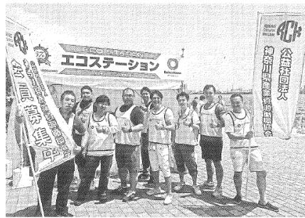
横浜開港祭会場に、エコステーションを設置してごみの分別回収を行った（神奈川）