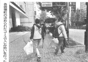
宿場町めぐりながらゴミ拾いを行った