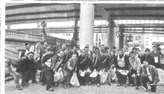
11月10日朝、日本橋でスタート。東京都のメンバーも参加した