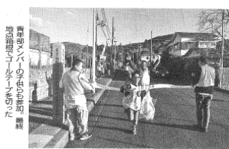
青年部メンバーも参加、清掃活動の様子を撮影した。

「東海道宿場町対抗」は、11月10日朝、日本橋でスタート。東京都のメンバーも参加した。この活動は、東産協青年部が主催し、神奈川県産業資源循環協会が協賛している。参加者は、日本橋から箱根までの旧宿場町をめぐりながら、ゴミ拾いを行った。この活動は、環境意識の向上と、地域の美化を目的としている。参加者は、ゴミ拾いの他にも、清掃活動や、環境教育などを行っている。この活動は、東産協青年部の活動の一つであり、地域の活性化に貢献している。