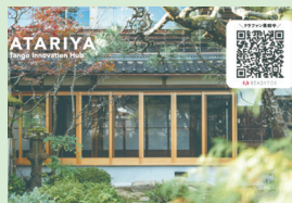
ATARIYA Tango Innovation Hub