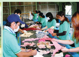
山本清掃京丹波ウエス