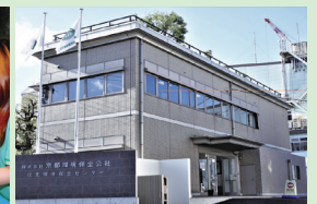
京都環境保全公社株式会社(本社)