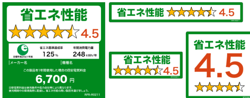
(冷蔵庫のイメージ)