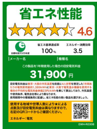
(電気温水機器のイメージ)

※ 照明器具、テレビジョン受信機、家庭用電気冷蔵庫、家庭用電気冷凍庫、温水機器及び電気便座については、2020年11月及び2021年8月に上記様式に変更済。今後、家庭用エアコンディショナーについても上記様式に倣ったものに変更予定。 なお、温水機器以外は、製品のサイズやネット取引等の限られたスペースで使用する場合は右側のミニラベルを活用すること。