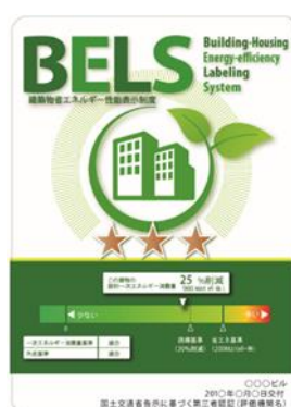
[図1] ガイドラインに基づく第三者認証の例

消費者への認知度向上を図るため、ZEHビルダー/プランナーをはじめとするZEHに関係する事業者は、インターネットやテレビ、雑誌等の広報媒体を介して、ZEHマーク[図2]とともに光熱費低減やヒートショック関連の健康リスクの低減といったZEHのメリットを積極的に発信すること。