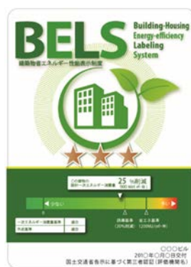
〔図1〕 ガイドラインに基づく第三者認証の例

また、ダイヤモンドリスponsに対応した時間帯別・季節別の電気料金メニューが選択できる場合はその活用にも努めるとともに、エネルギー管理システム（BEMS・HEMS等）の導入により、ビルの運用方法、住宅の住まい方の改善によるピーク対策及び省エネルギーに努めること。