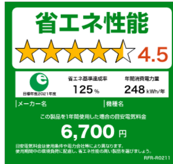
(冷蔵庫のイメージ※)