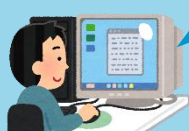
システムへログイン