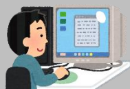
様式をダウンロード