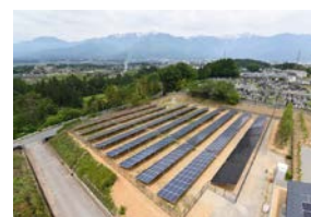
リユース品を使用した発電所