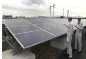
太陽光パネルの外観検査

使用済みとなった太陽光パネルについても、再販売可能なものもある。既に多くのリユース事例が報告されている。