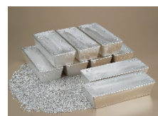
有用金属（銀）のイメージ