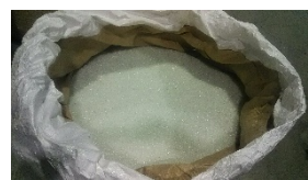
破碎・選別したガラス