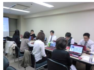
体験セミナーの様子

公益社団法人神奈川県産業資源循環協会（地図参照） 横浜市中区山下町1 シルクセンター2階 TEL (045) 681-2989