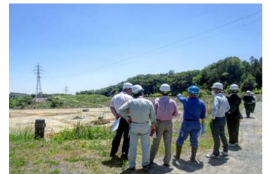
都築鋼産株式会社の見学会