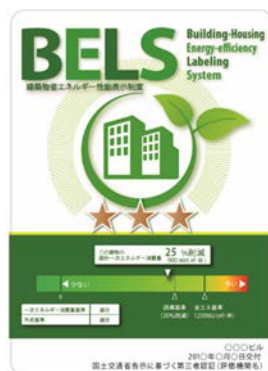
〔図1〕 ガイドラインに基づく第三者認証の例

また、ダイヤモンドリスponsに対応した時間帯別・季節別の電気料金メニューが選択できる場合はその活用に努めるとともに、エネルギー管理システム（BEMS・HEMS等）の導入により、ビルの運用方法、住宅の住まい方の改善によるピーク対策及び省エネルギーに努めること。