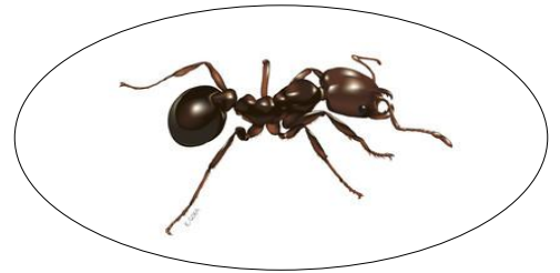
【五箇氏作図 ヒアリ】