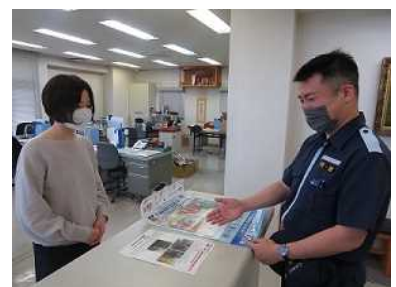
海事関係者への訪問指導