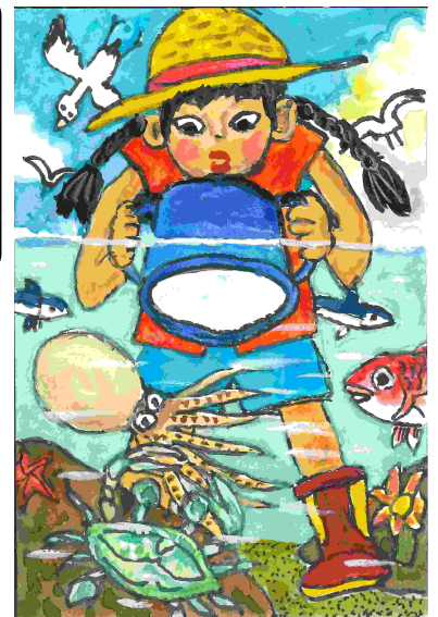
第23回 特別賞（国土交通大臣賞）受賞作品