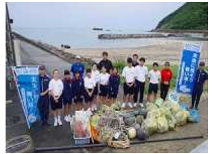
「海ごみゼロウィーク」一斉清掃

※ 環境省及び公益財団法人日本財団が、海洋ごみ対策に関する共同事業として、5月30日（ごみゼロの日）から6月5日（環境の日）を経て6月8日（世界海洋デー）前後の期間を「海ごみゼロウィーク」として定め、海洋ごみ削減に向けた全国一斉清掃活動を行い、その取組結果を世界へ発信していくもの。