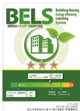
[図1] ガイドラインに基づく第三者認証の例

また、ダイヤモンドリスponsに対応した時間帯別・季節別の電気料金メニューが選択できる場合はその活用に努めるとともに、エネルギー管理システム（BEMS・HEMS等）の導入により、ビルの運用方法、住宅の住まい方の改善によるピーク対策及び省エネルギーに努めること。